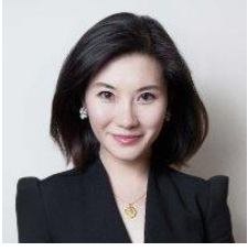
陈一佳， 路透社知名主持人