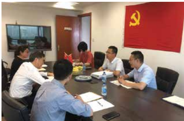
调研组在达隆所座谈

6月16日至17日，全国律师行业党委委员、中华全国律师协会副会长章靖忠一行来到上海，开展律师行业党建全覆盖“回头看”与推进全规范调研指导工作。