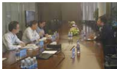
调研组访谈律所代表

发展，为全国律师党建工作提供可复制、可推广、可借鉴的实践经验，不断提升新时代律师行业党建工作水平。