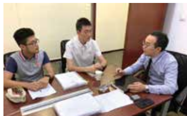
上图：黄浦律所职业见习活动启动仪式 下图：实习同学跟随带教律师学习

年律师们认真、敬业的工作态度，专业、严谨的职业素养，以及不断学习、进取的状态所打动。上海律协青年律师工作委员会副主任潘雄律师也和同学们分享了自己职业生涯的感悟，他希望同学们能够珍惜这三天的职业见习，把它当成将来职业道路上一份宝贵的经验，也希望能有越来越多的同学通过中学生共产主义学校的律所见习活动，选择法律的道路，投身律师业。