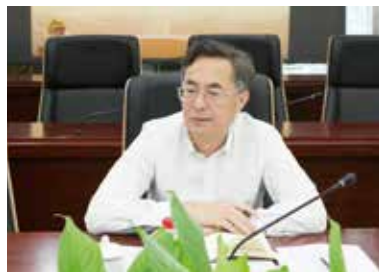
全国律协章靖忠副会长讲话

章靖忠副会长表示，上海推进律师事务所党组织规范化建设工作较为扎实，颇有成效，形成了良好的氛围，达成了基本的共识，并立足于上海律师行业现状、发展规律和自身特点，探索出了“上海经验”。在今后的工作中，上海市应进一步稳中求进，突出律师行业党建工作的“政治引领”“专业引领”“文化引领”“规范引领”和“公益引领”作用。作为党的诞生地，上海要以更高的要求、更实的行动、更大的决心，着力推动上海律师队伍和律师事业