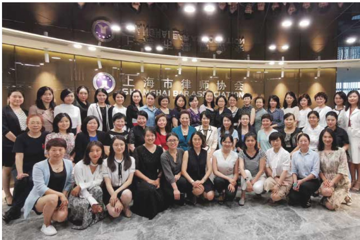
第十届上海市女律师联谊会理事会合影

五、针对目前仅有国有企业法务实行公司律师制度的现状，积极进行广泛的调查研究，通过与民营企业法务座谈交流，推进公司律师制度在民营企业法务方向的发展。