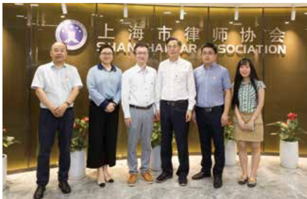
调研组一行在上海律协调研