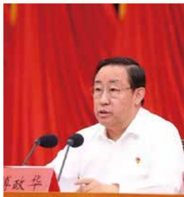
司法部部长傅政华讲话

会议对全国律师行业97个先进党组织、201名优秀党员律师和50名优秀党务工作者进行了表彰。