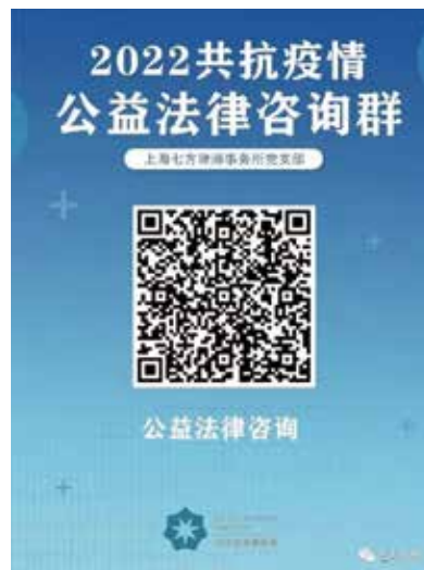
上海七方律师事务所建立公益法律咨询群，为群众提供线上法律咨询。