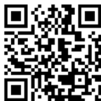
扫码可看视频演讲

每个人以组织为荣耀，组织因每个人而强大。我们要走的路，很远、很长。独行者快，众行者远。我们从善之初心出发，牢记初心、守望初心、践行初心，凝心聚力，善始善终。