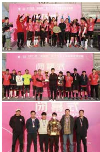
由上至下： 冠军：长风足球队 亚军：道朋足球队 季军：瀛在东方足球队

2月27日，由上海市律师协会主办、上海道朋律师事务所冠名及承办的2021“道朋杯”第十九届上海律师足球联赛决赛及闭幕式颁奖仪式在上汽浦东足球场锦江航训训练场落下帷幕。上海律协副会长朱